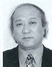
(株)留萌新聞社 飯沢 信