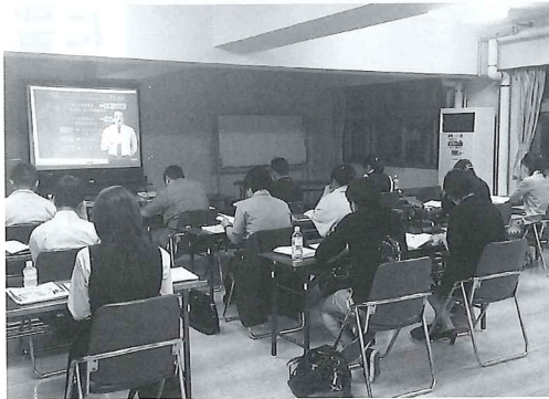
十二名が真剣に講座を受講した。