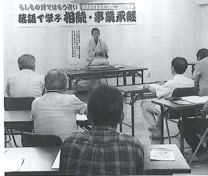
兄弟や家族の絆をしっかりと相続してもらおう事で相続問題を回避できるとアドバイスを受け、参加者は相続・事業承継の理解を深めた。